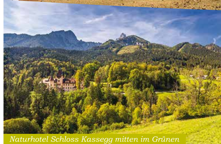
Naturhotel Schloss Kassegg mitten im Grünen